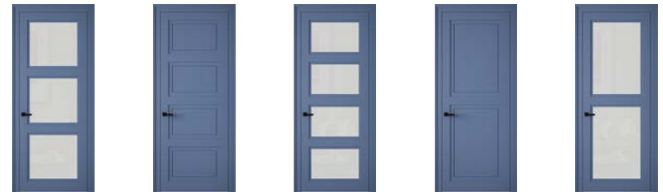
lucky 3D0 lucky 4DG lucky 4D0 lucky 22DG lucky 22D0