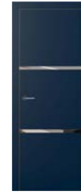
exit G2 slim