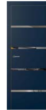
exit G4 slim