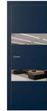
exit G2 plump