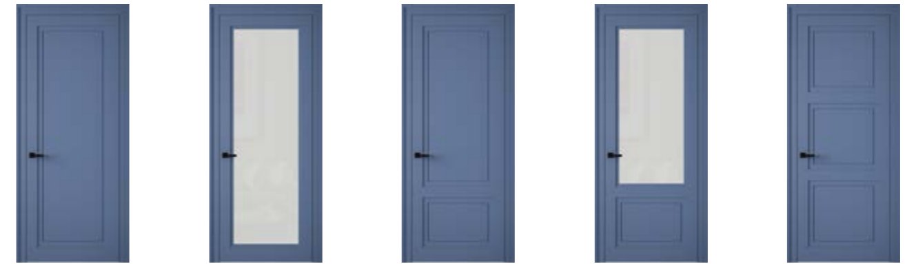
lucky 1DG lucky 1D0 lucky 2DG lucky 2D0 lucky 3DG