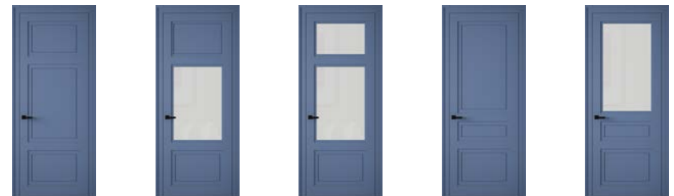
lucky 32DG lucky 32D01 lucky 32D02 lucky 33DG lucky 33D01

Коллекция LUCKY – современный выбор проверенных временем дизайнерских приёмов и методов. Двери в стиле этой коллекции являются одними из самых популярных, находятся на пике восходящего тренда.